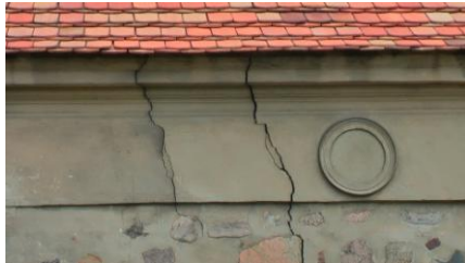
Foto Riss Mauer

Wenn schon dicke Feldsteinmauern unter der Last der Jahrhunderte auseinanderreißen, dann sind Hilfe und Sanierung dringend notwendig. Der Förderverein , der am 6.3.2013 gegründet wurde, will sich mithilfe fast der gesamten Dorfgemeinschaft gegen den Verfall stemmen. Er besteht z. Z. aus 35 Mitgliedern und hat bereits einige bürokratische Hürden genommen. Seine Gemeinnützigkeit verdankt er u.a. der Tatsache, dass die Wollenberger Kirche (13.Jh.) unter Denkmalschutz steht. Es muss uns Anliegen und Pflicht sein, unsere Feldsteinkirche vor dem Verfall zu retten. Denn die vor etwa 50 Jahren erfolgten Reparaturen erfüllen keinen notwendigen Zweck mehr.